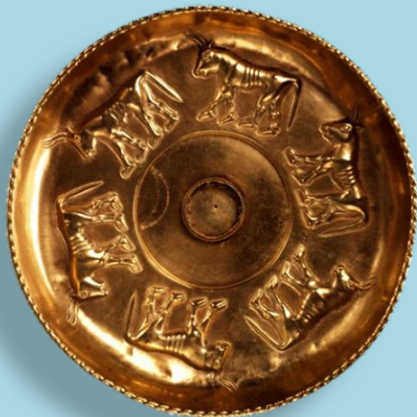
Coppa aurea con bovidi a sbalzo. Oreficeria sicana da Sant'Angelo Muxaro. VII-VI secolo a.C. Londra, British Museum.