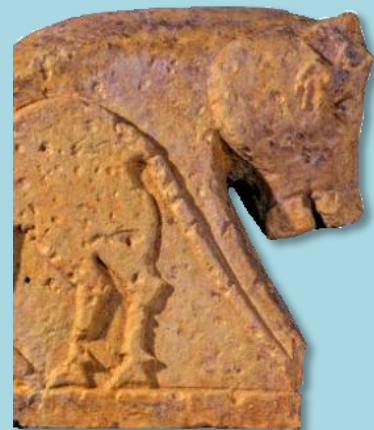
Dettaglio del Guerriero di Castiglione raffigurante un bovide. Scultura sicula. VII-VI secolo a.C. Ragusa, Museo Archeologico Regionale.

Teatro Antico – Sala dell'Esedra Via Teatro Greco Mercoledì 12 aprile 2017, ore 17,30